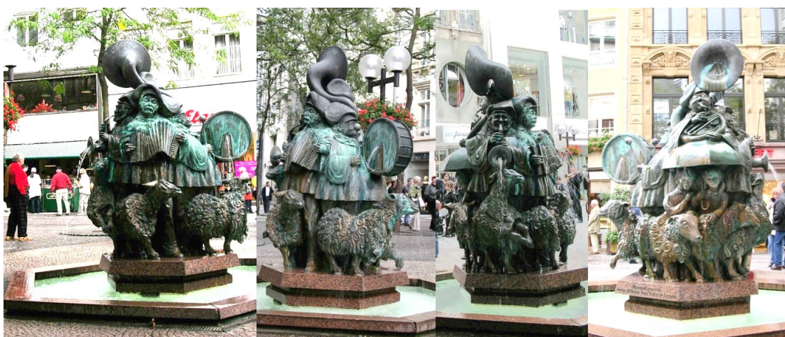
Fig. 1: Hämmelsmarsch (1982), sculpteur Wil Lofy, Luxembourg.

Ainsi, il semble également important d'attirer l'attention de l'UNESCO sur la grande fortune patrimoniale, esthétique et éducative de la Statuaire Urbaine.